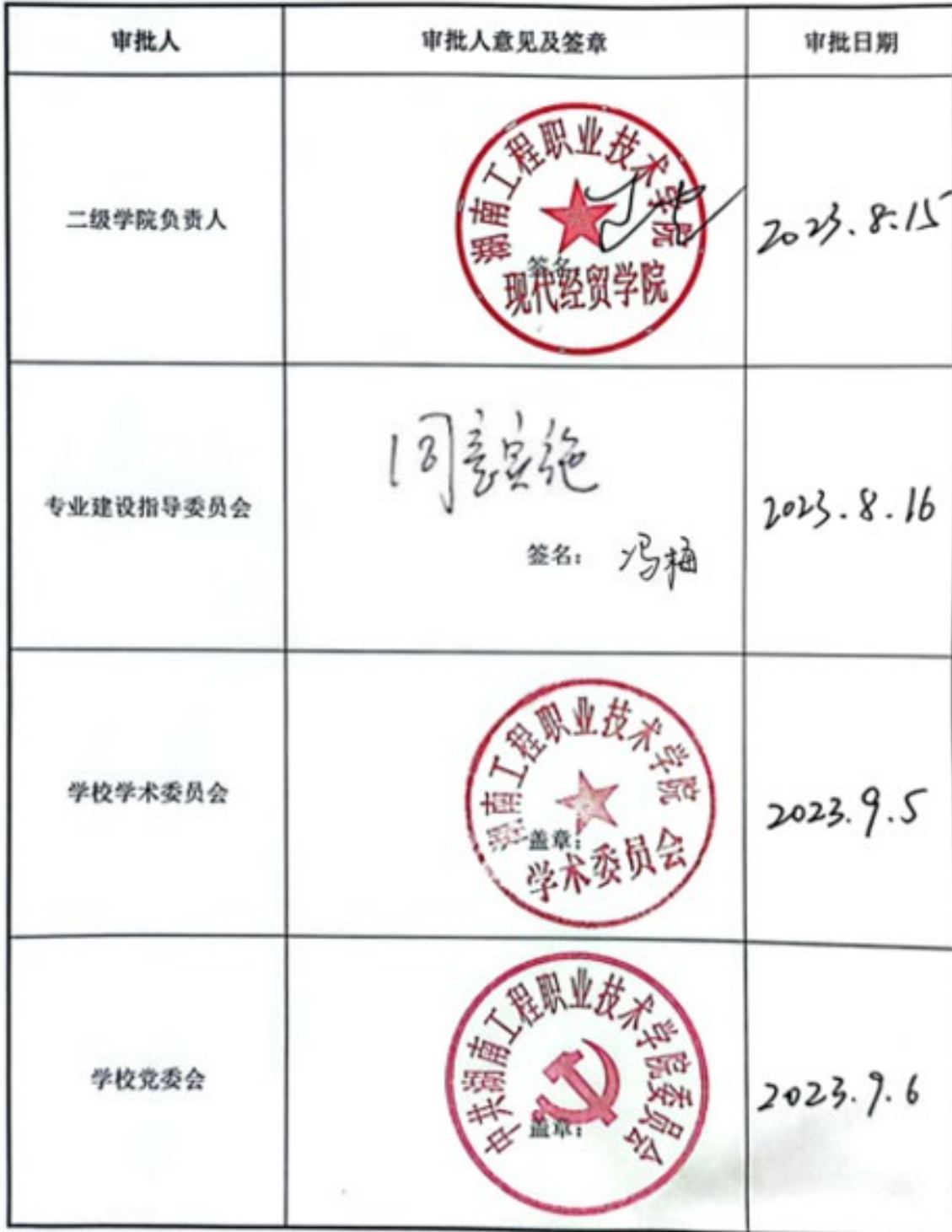
现代物流管理专业人才培养方案审定表