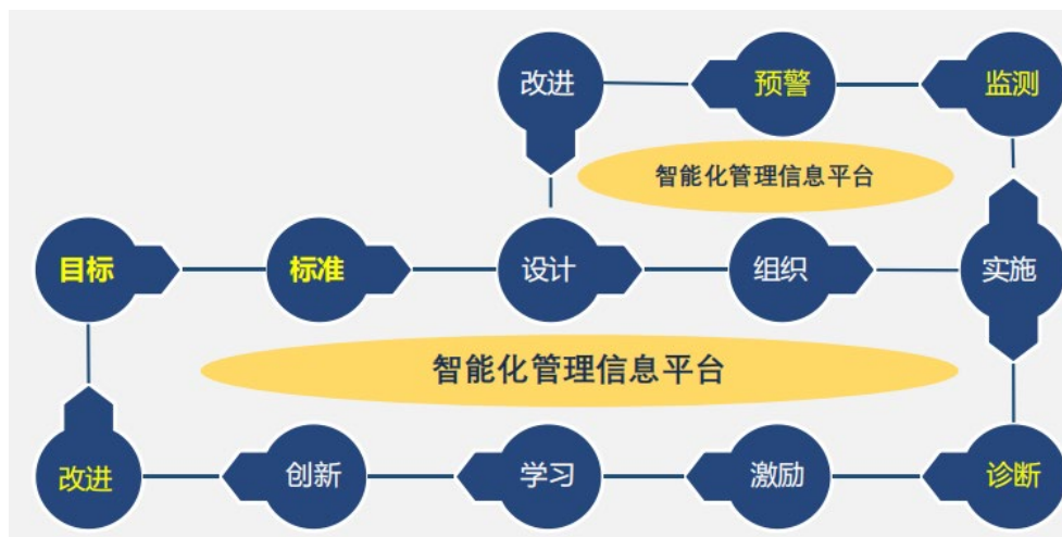
图 3 专业诊断与改进

1. 建立专业建设和教学质量诊断与改进机制如图 3 所示，健全专业教学质量监控管理制度，完善课堂教学、教学评价、实习实训、毕业设计以及专业调研、人才培养方案更新、资源建设等方面质量标准建设，通过教学实施、过程监控、质量评价和持续改进，达成人才培养规格。