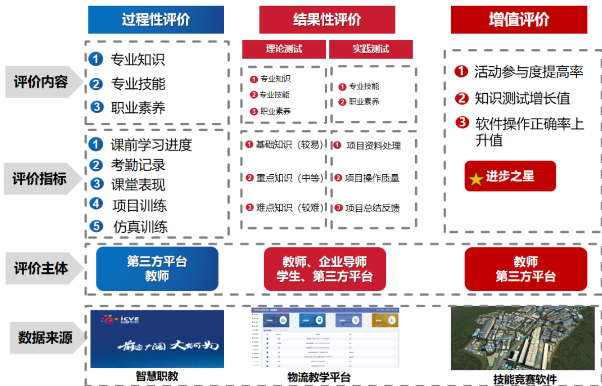
图 2 专业教学评价图

技能性的课程主要为专家评价，岗位实习主要为企业评价。评价方法多元。包括表现性评价、形成性评价、增值性评价和终结性评价等。有效运用运用大数据、人工智能等信息技术进行教学行为分析对学生的知识掌握、学习表现、合作态度、职业意识、操作安全、成果质量、问题解决的方法以及创新精神等内容进行考核，有效、公正地评价学生学习绩效，全面考核学生的实践能力和分析问题与解决问题的能力。评价方式多元。本专业根据课程特点采用不同的评价方式，可采用闭卷考试、现场操作、展示与表演、作品报告、答辩等方式进行课程考核，具体评价形式如图 2 和表 19 所示：